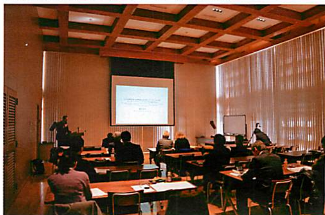
写真. ワークショップの様子。

三本の報告に続くディスカッションでは、埋蔵文化財の社会的運用をめぐる活発かつ真摯な議論がなされ、当センターの諸活動を、ここで議論されたようなファクターを意識しつつ社会還元してゆくことの重要性和課題を確認した。当センターでは、このような成果に基づき、引き続き埋蔵文化財調査研究と社会とのインターフェイスのよりよいありかたにつき、研究を継続し具体的成果を挙げて行く予定である。