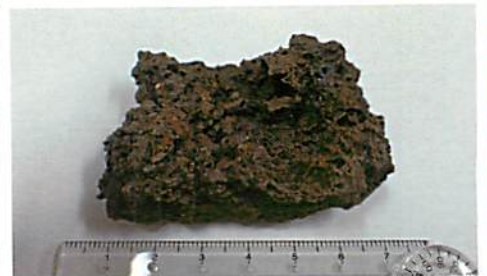
写真上。愛媛大学東アジア古代鉄文化研究センターの村上教授から提供された、カザフスタン・アラト遺跡出土のスラグ（炉底滓）資料。